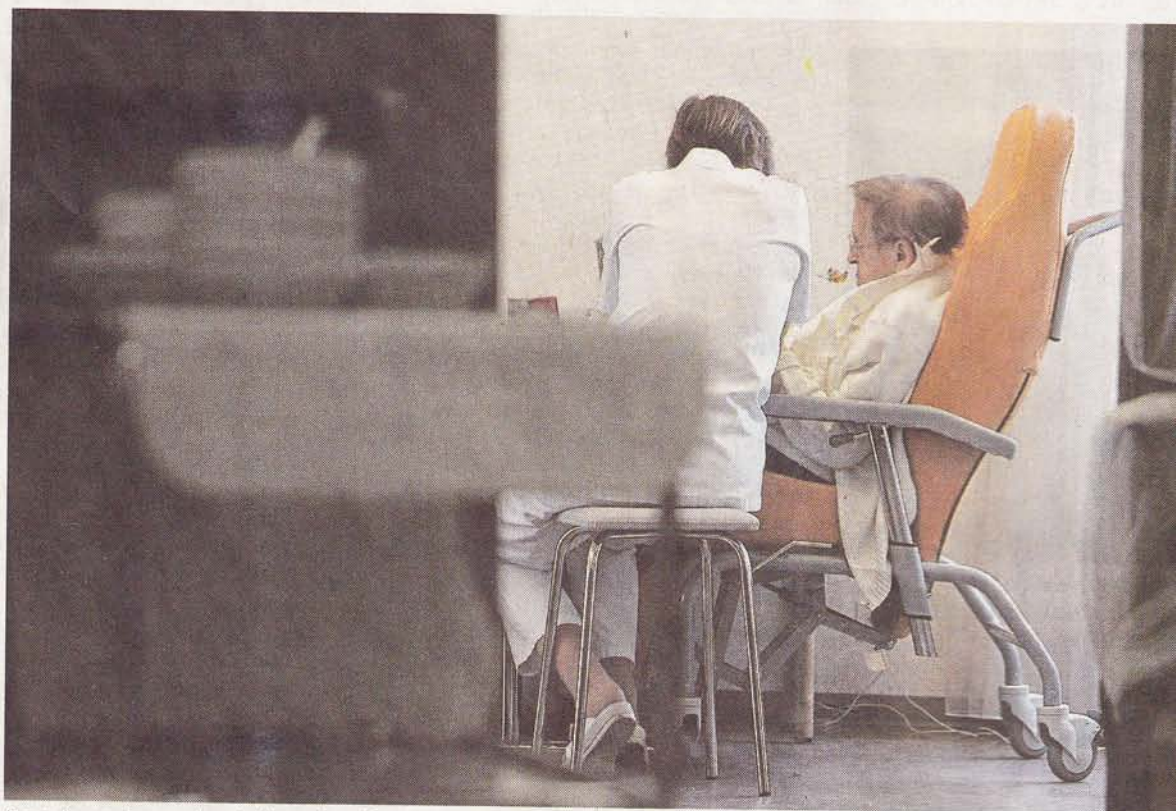
Dans les maisons de retraite ou les hôpitaux, des résidants se plaignent d'infantilisation, d'humiliations...

La belle fille en fauteuil. « Moi, j'ai envie de vous parler d'une fille de 23 ans, jolie comme un cœur, en fauteuil électrique. Elle revendique de mener une vie affective et sexuelle. Moi dans l'équipe du foyer où elle