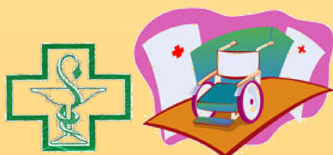
Prestataire (pharmacien ou revendeur de matériel médical)