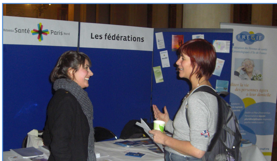
La FREGIF était présente sur le stand réservé aux fédérations de réseaux de santé.

Sur l'impasse du choix : peut-être n'y a-t-il pas de réponse, pas de synthèse possible, car il est difficile de se réconcilier avec la douleur de vieillir, avec la solitude, avec la mort. Mais l'intérêt de ces questions est sans doute d'en faire émerger d'autres. S'il n'y a pas de synthèse possible, il y a peut-être une langue commune, qui permettra le débat, même si celui-ci est contradictoire. Le discours philosophique peut permettre de tempérer les choses.